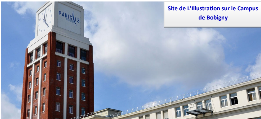
Site de L'illustration sur le Campus de Bobigny

Une inscription en PASS décompte obligatoirement une première chance d'entrer dans les études de santé.