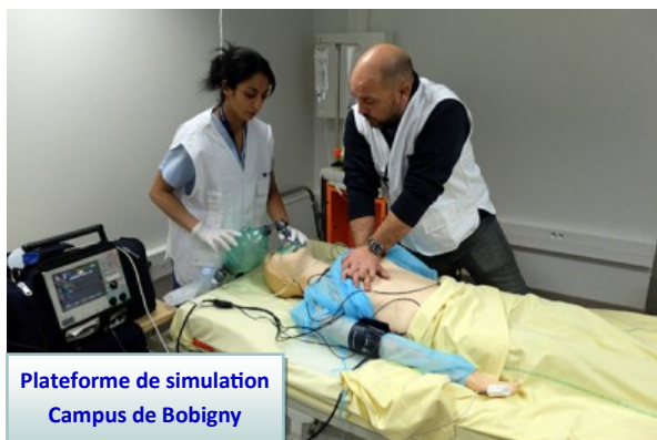
Plateforme de simulation Campus de Bobigny

-Exemple : si je suis inscrit en PASS option droit, je pourrais poursuivre en 2 e année de la licence de droit.